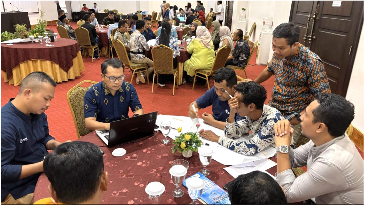
Foto bersama dan proses diskusi kelompok pada saat kegiatan