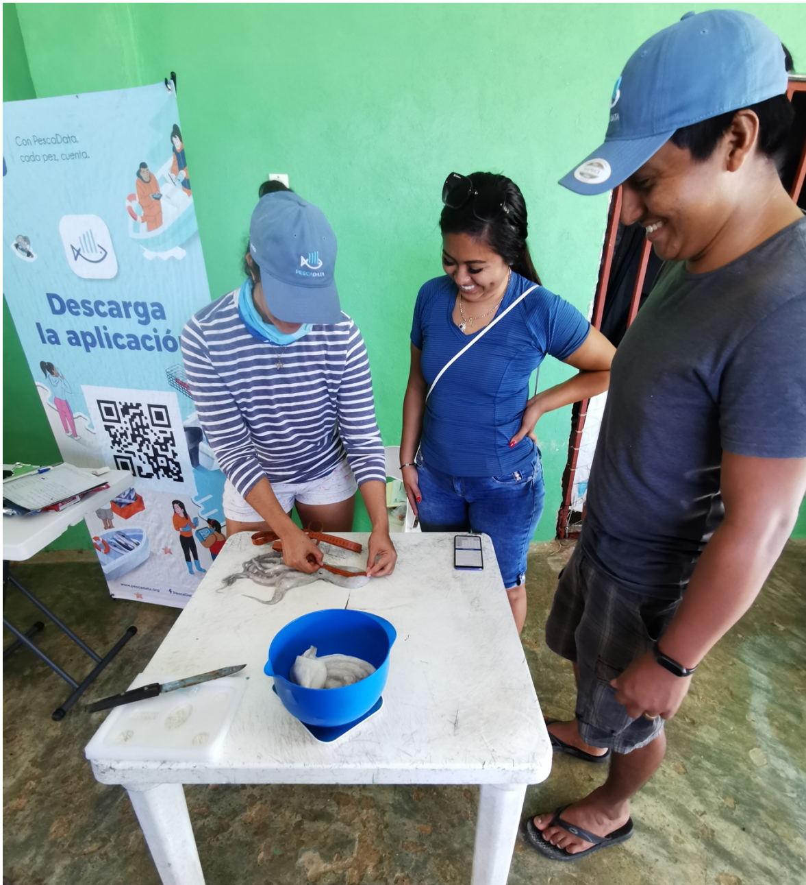
Figura 3. Reafirmación de conocimientos con practicas presenciales para la toma de biometrías de pulpo, identificación de sexo, longitud de manto y peso total.