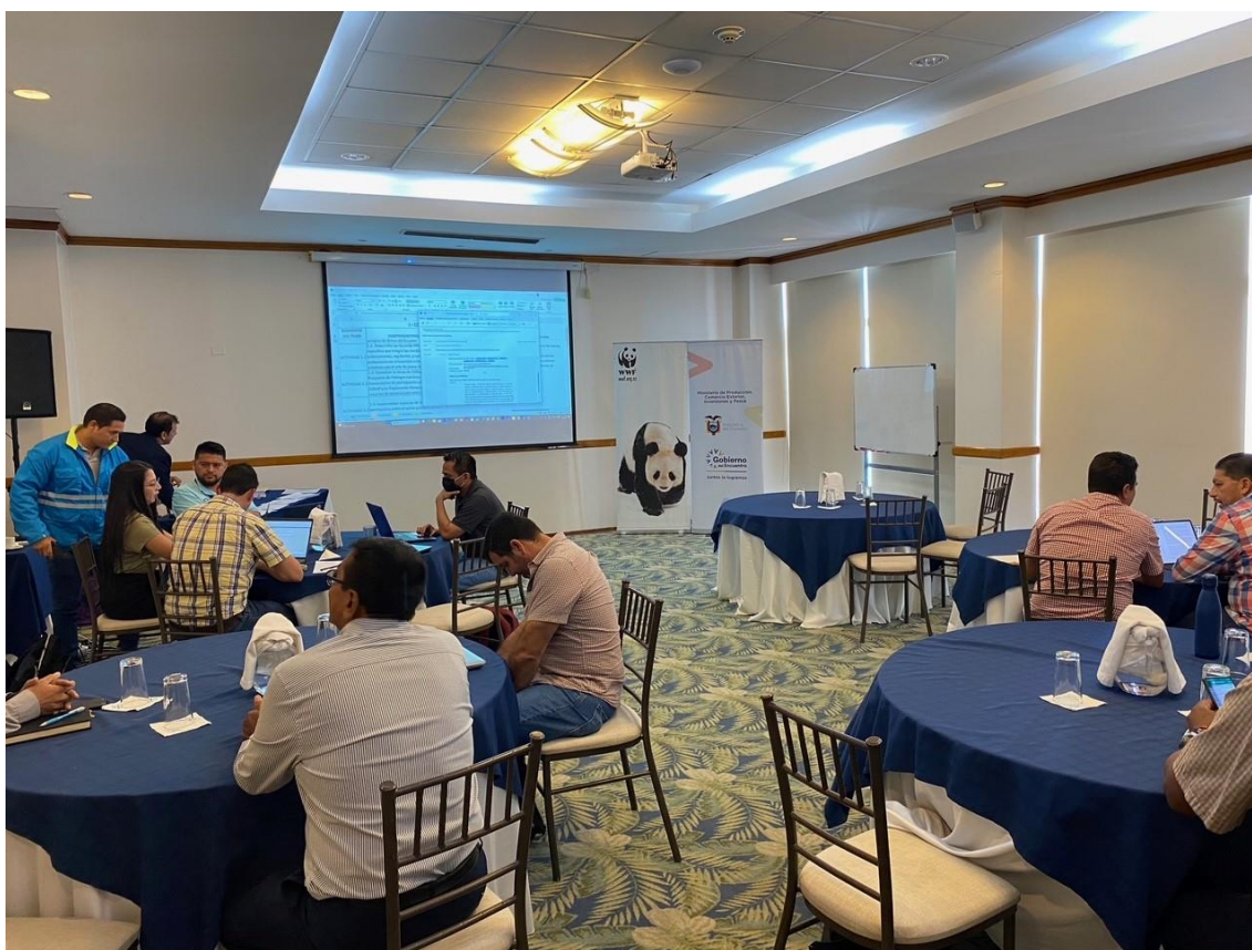
Anexo1. Taller presencial con el personal de la SRP y actores interesados, donde se propuso mejorar el proceso de mejora de la base de datos.