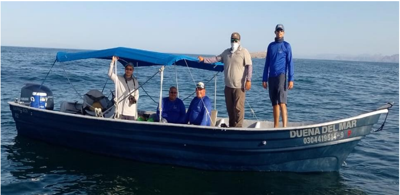
Figura 3. Apoyo marítimo de la Red de Observadores Ciudadanos (ROC), con quienes colaboramos dentro del Subcomité de Vigilancia comunitaria. Además de la impartición de capacidades tecnológicas, registro de bitácoras y recorridos en mar y tierra.