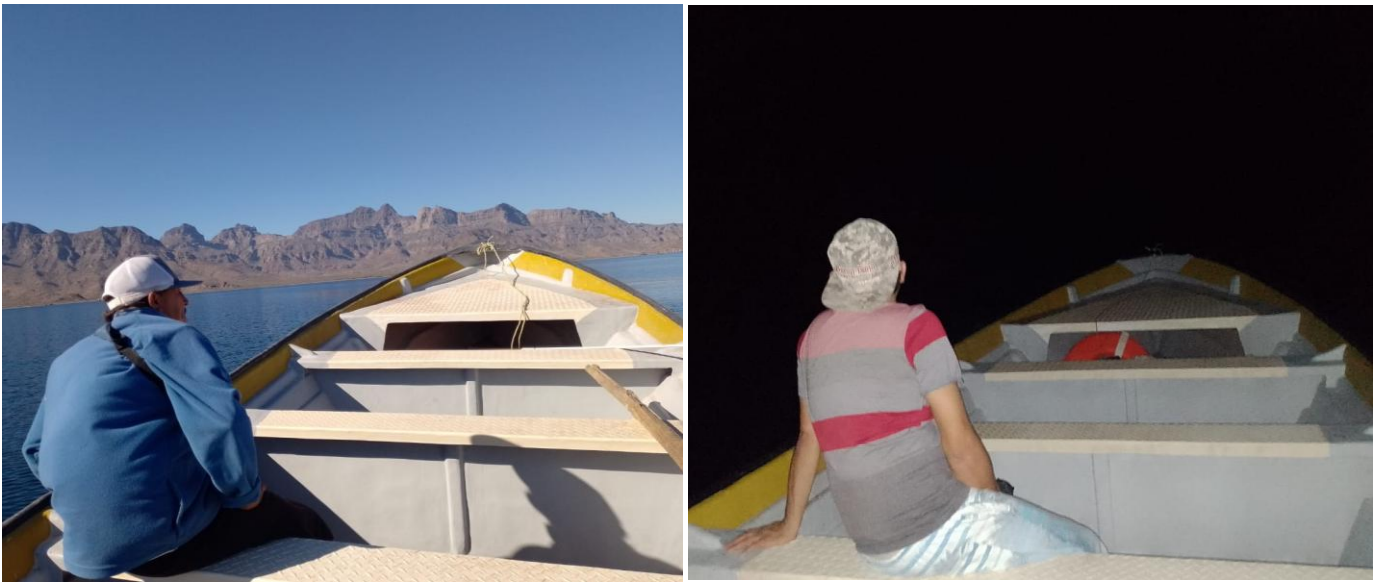
Figura 2. Vigilantes comunitarios en recorrido (izquierda; recorrido diurno y derecha; recorrido nocturno).

Como parte de las actividades y colaboraciones en estos recorridos de vigilancia se muestran las imágenes en campo del equipo de vigilancia comunitaria (Figura 2), muestra del trabajo in situ de los recorridos. El apoyo y coordinación con el equipo de ROC, en presencia y recorridos de vigilancia en sus visitas a la comunidad de Agua Verde (Figura 3).