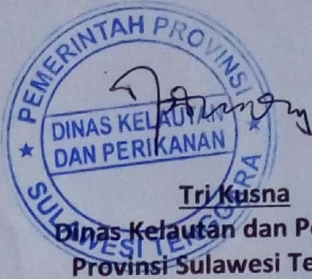
Kurmawan Pelabuhan Perikanan Samudera Kendari